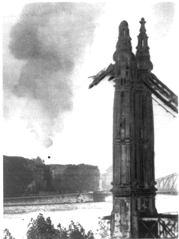
Kettenbrücke in Budapest 1956

Daraus resultieren aber auch die Schattenseiten des irischen Wunders: Das zusätzliche »Einkommen« besteht zu einem erheblichen Teil aus den Gewinnen der ausländischen Konzerne. Der Anteil der Löhne am Volkseinkommen ist dagegen dramatisch gesunken.